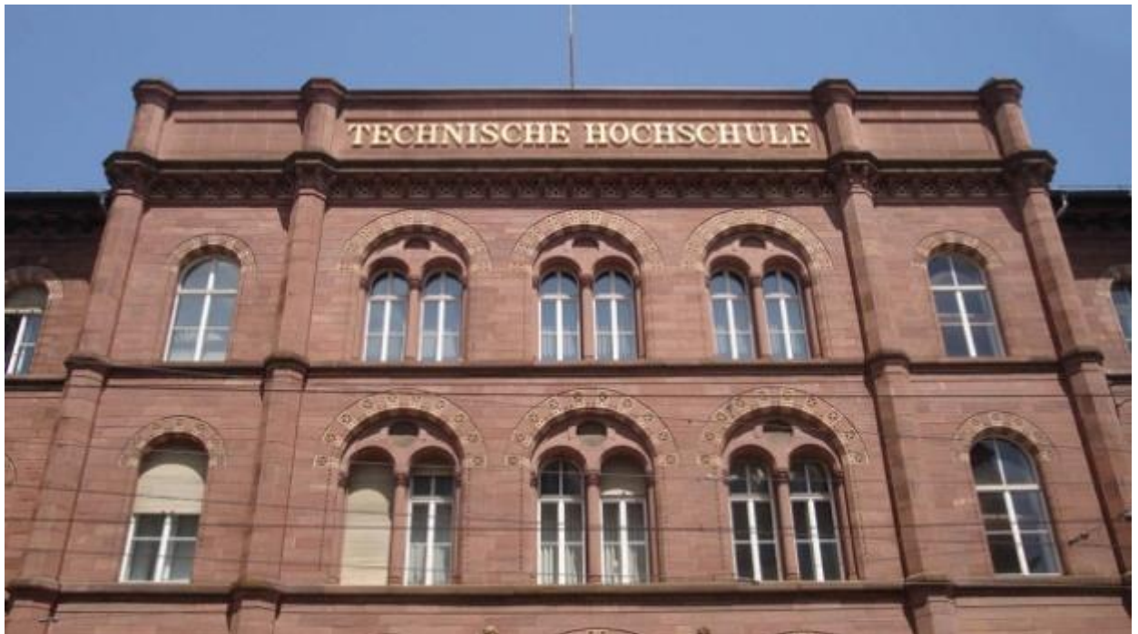
Technische Hochschule Karlsruhe.

In Deutschland kannst du an Universitäten, Fachhochschulen sowie Kunst-, Film- und Musikhochschulen studieren. Welcher Typ der richtige für dich ist, hängt unter anderem davon ab, was du studieren willst. Es gibt außerdem eine Unterscheidung in staatliche und private Hochschulen. Die Qualität ist an allen vergleichbar gut.