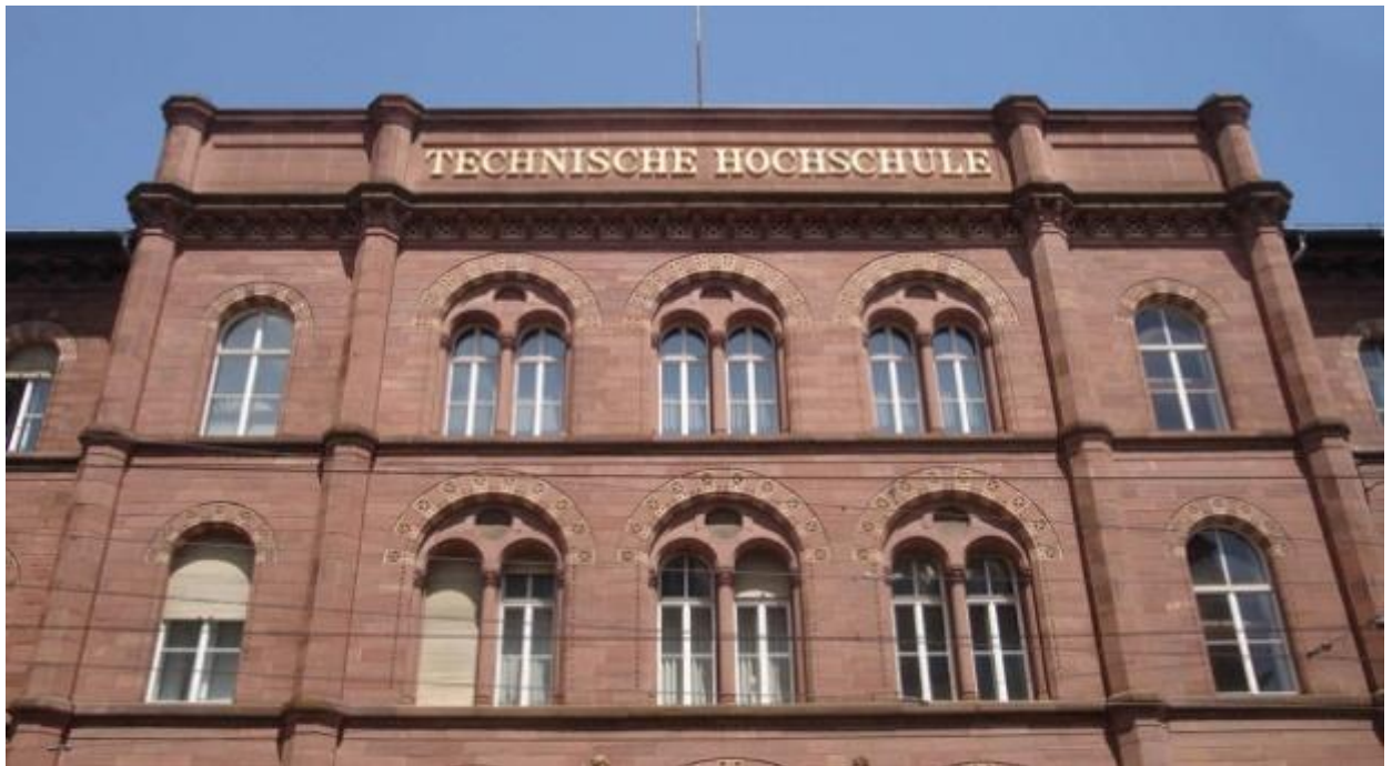
Technische Hochschule Karlsruhe.

In Deutschland kannst du an Universitäten, Fachhochschulen sowie Kunst-, Film- und Musikhochschulen studieren. Welcher Typ der richtige für dich ist, hängt unter anderem davon ab, was du studieren willst. Es gibt außerdem eine Unterscheidung in staatliche und private Hochschulen. Die Qualität ist an allen vergleichbar gut.